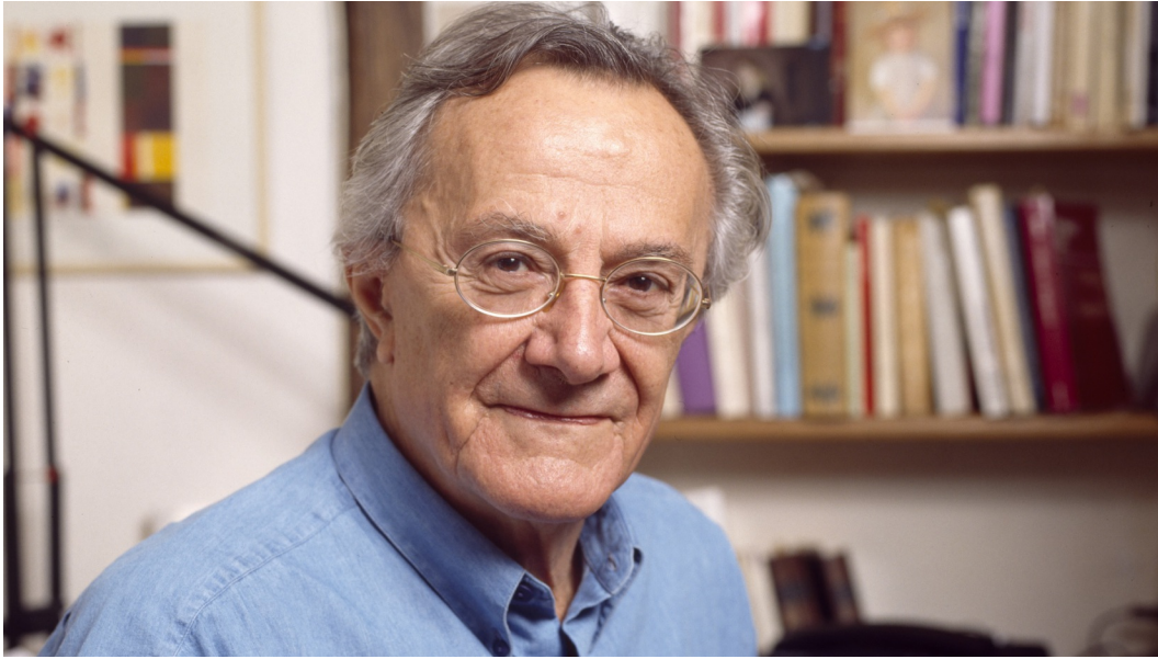
صورة 1 جان فرونسوا ليوتار (من كبار مفكري ما بعد الحداثة)