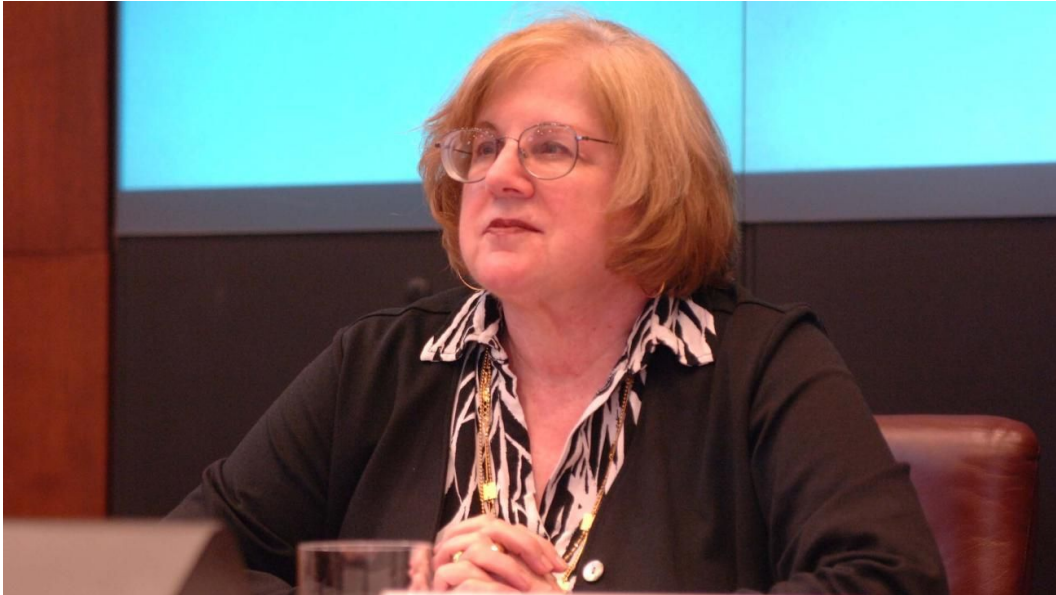
صورة 3 إيلين شوالتر

إيلين شوالتر هي ناقدة أدبية نسوية أمريكية، وأستاذة متقاعدة في الأدب الإنجليزي بجامعة برينستون، وزميلة في الجمعية الملكية للأدب. ولدت في 21 يناير 1941 في بوسطن، وحصلت على شهادة الدكتوراه من جامعة كاليفورنيا في 1970. تعد من مؤسسات مدرسة النقد الأدبي النسوي وصاحبة مصطلح "النقد النسائي" (Gynocriticism)، الذي طرحته في السبعينيات. تشمل اهتماماتها البحثية الأدب الفيكتوري، والنساء والهستيريا والجنون في الأدب. من أبرز مؤلفاتها: "أدب خاص بهن"، "المرض الأنثوي"، و"الجنة من أقرانها".