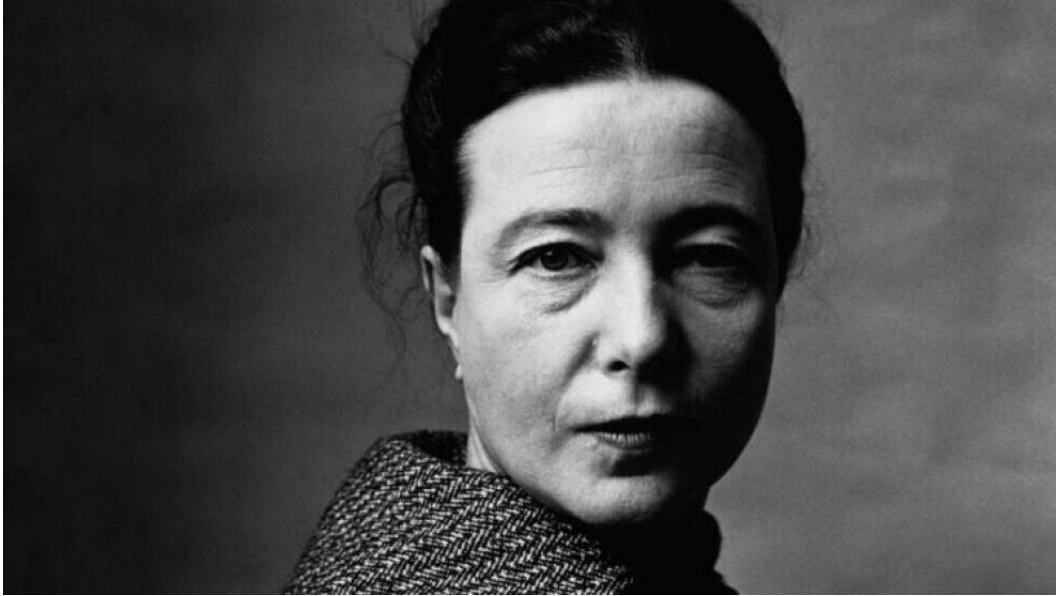
صورة 2 سيمون دي بوفوار

سيمون-إرنستين، لوسي ماري برتراند دي بوفوار، تدعى سيمون دي بوفوار، هي كاتبة وفيلسوفة ونسوية ووجودية فرنسية. اشتهرت بعلاقتها الرومانسية والفكرية مع جان بول سارتر، وبكتابها "الجنس الآخر"، الذي يعد من أهم الأعمال النسوية في القرن العشرين. كتبت أيضا روايات وسير ذاتية ومقالات حول السياسة والأخلاق والاجتماع. تعتبر من رواد الفلسفة الوجودية والنسوية والماركسية الغربية. حصلت على عدة جوائز أدبية وتم تكريمها بعدة طرق، مثل تسمية جسر في باريس باسمها.